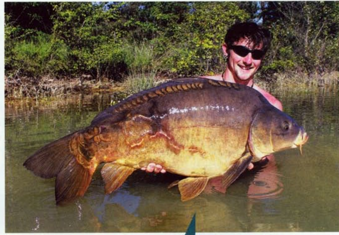
„Moje první dovolená na kaprech a na tomto kaprovi jsme našli mapu k pokladu.“