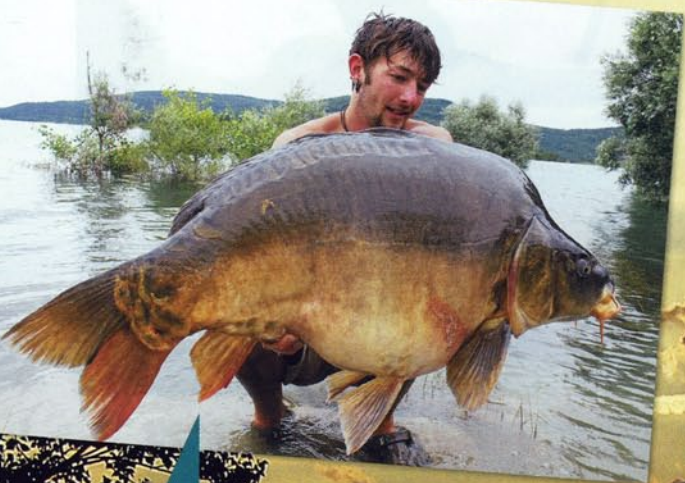
„Byl sem velmi šťastný, když jsem držel tohoto 26kg obra ve své náručí.“