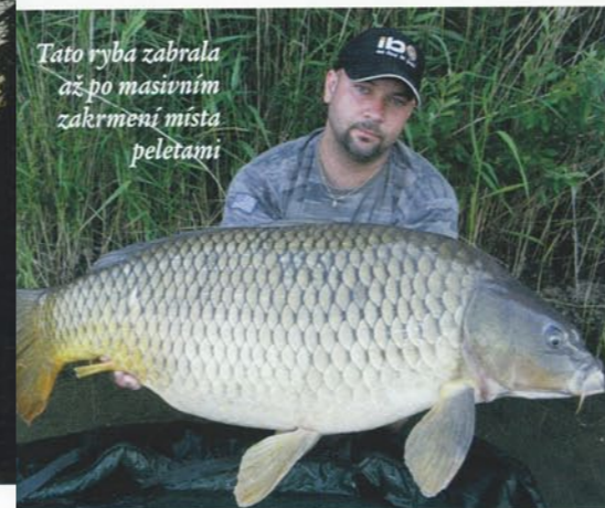
Tato ryba zabrala až po masivním zakrmení místa peletami

začal cpát do PVA punčošky a vytvořil tak mnoho malých bombiček. Ty jsem potom pomocí velkého praku začal střílet do krmného místa. A světe div se, kapři opravdu začali sbírat potravu ze dna. Cca po 30 minutách jsem měl na prutu první rybu. Částičky z polorozpadlých pelet a atraktivní obal vytvořený