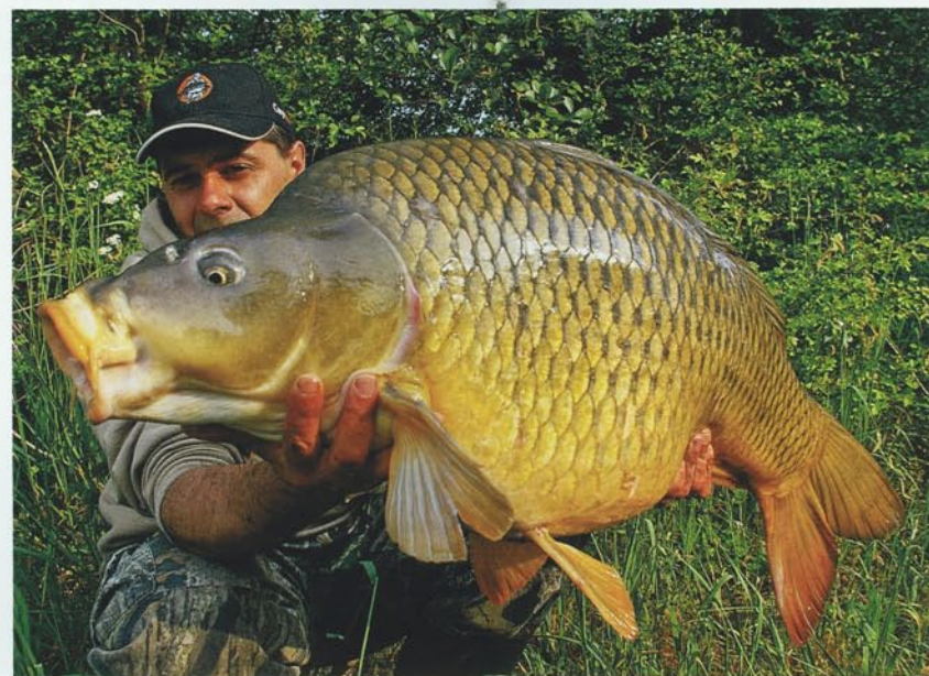
Mosele i na řekách se ryby naláka pořádně sousto. V tomto případě o dvoji boilie o průměru 30 mm. Bernard.

Když jsem tuto oblast převzal začátkem července na začátku své 12ti denní výpravy, měl jsem zpočátku pochybnosti, za které mohl hlavně prudký pokles vodní hladiny. Více, než 2 metry během 20 dní! Mé chmury se však rychle rozplynuly. V duchu Liova hesla „buď ohnout, nebo zlomit“, jsem první ráno do vody nasypal 15 kilo velkých kuliček, směs Imperial Baits Monster Liver o průměru 28 mm, Osmotic