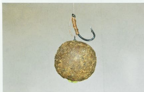
Můj nej-oblíbenější koncový návazec XXL: D-rig s posuvným mini-obratlíkem na smyčce, kde se upevňuje nástraha. Bernard Hesse

gramů a oděru odolný silnější šokový návazec, který spojm s hlavním monofilním vlascem o průměru minimálně 0,35 mm. Zdá se Vám to silné? Když se nějaký obr konečně ohlásí, musí také skončit v síti podběráku!