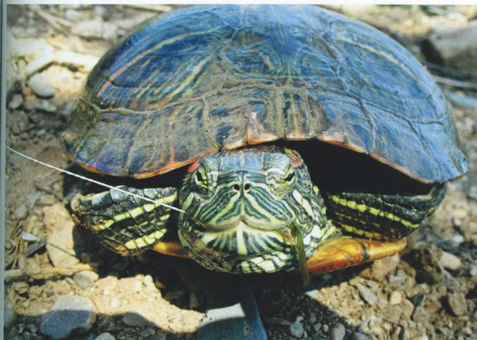
Větší průměr návnady je velmi efektivní v boji proti trpasličím sumcům, želvám a jiné „havěti“. Bernard Hesse

Čas od času lovím na vodě, která je příliš vzdálená na to, abych tam trávil všechny volné víkendy. Přesto tam žije několik velkých ryb a hodně menších kaprů s enormní touhou po krmení. Teprve po několika desítkách výprav u této vody jsem pochopil, že návnada klasického průměru 20 – 22 mm mi přinesla skutečně několik slušných ryb (některé z těchto extrémně žravých kaprů jsem vylovil dokonce dvakrát, nebo třikrát), ale skutečně velcí kapři se neukázali. Buď jsem mohl změnit strategii, nebo se spolehnout jen na štěstí a k vodě se vypravovat častěji. Zamyslel jsem se a došel k závěru, že